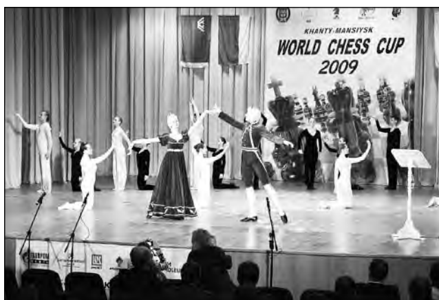
Открытие III Кубка мира по шахматам.