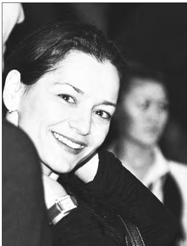
Александра Костенюк. Ну чем не кинозвезда?