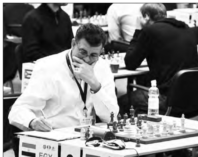
Похоже, пора домой...