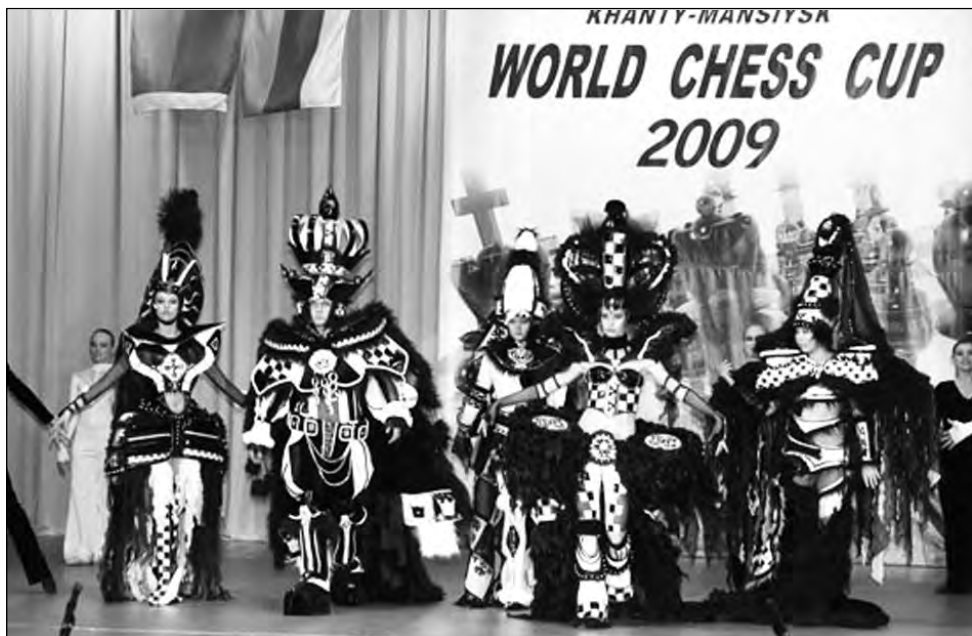
В Югру пришла мода на шахматы.

нокаут-системе сразу же отметили в сторону ничейные результаты, которыми изобилуют шахматы.