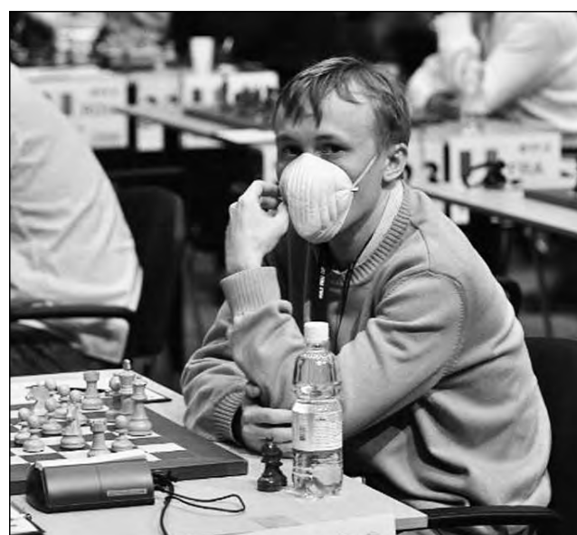
Береженого бог бережет.