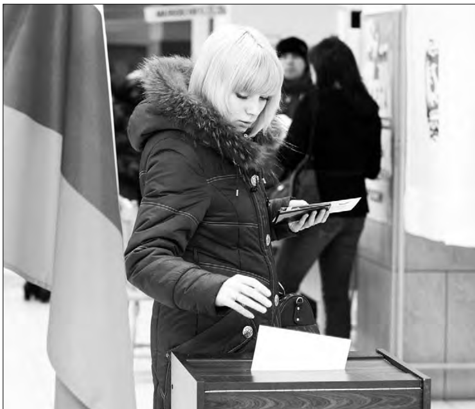
Будет ли молодежь голосовать за кандидатов-сверстников?