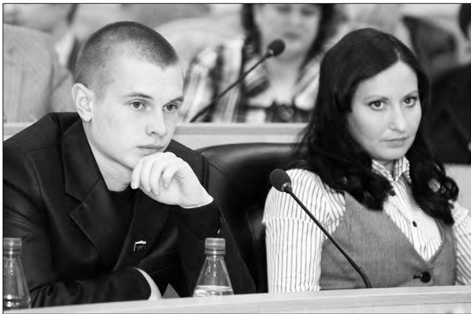
Молодежи придется доказать работой, что они достойны звания депутата.

Игорь Бурмасов.