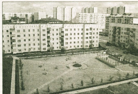
Новые микрорайоны Нижневартовска.

Другое дело, что мы приняли решение компенсировать это повышение из городского бюджета до 1 мая - другими словами, защитить жителей хотя бы на 5 месяцев. Это продиктовано опять же экономическими сложностями. Я считаю, что местная власть должна приложить максимум усилий для поддержания определенной стабильности.