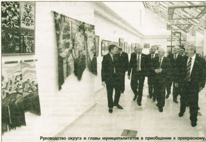
Руководство округа и главы муниципалитетов в приобщении к прекрасному.

Что касается привлечения кредитов, то я считаю, мы очень взвешенно и осторожно относимся к этому вопросу - поскольку единственным способом возврата кредитных средств является повышение тарифов для населения, а это тысячи семей. Для развития материально-технической базы коммунальных предприятий мы используем разные методы. С одной стороны, мы привлекаем кредитные средства, правда, не такие большие. В среднем около 100 млн. рублей. Это недостаточно для решения всех проблем в коммунальной сфере, но позволяет сделать определенный шаг в сторону решения конкретной проблемы, рискуя минимально. С другой стороны, перед всеми руководителями предприятий сферы ЖКХ поставлена задача использовать внутренние резервы. Очень показатель-