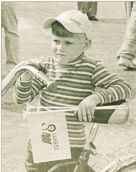
Фотомонтаж Барбары Кочетковой