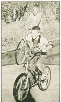
со стороны - пасторальная картинка...

Влажные от последних дождей дорожки - не преграда для роллерменов самых разных возрастов. Можно встретить малыша, который впервые встал на «колесики»: ноги разьежжаются, и родители бережно поддерживают свое чадо. - Дочка просит в подарок на день рождения ролики, - рассказывает мама семилетней девочки. - Прежде чем покупать, уговорили ее попробовать, получились ли кататься на них. Взяли ролики в аренду.