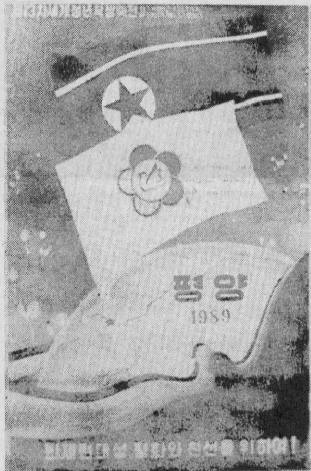
КНДР. ПЛАКАТ, ВЫПУЩЕННЫЙ К XIII ВСЕМИРНОМУ ФЕСТИВАЛЮ МОЛОДЕЖИ И СТУДЕНТОВ В ПСКОВЕ.

ПРОСЬБА К ЖИТЕЛЯМ ГОРОДА НАПРАВЛЯТЬ ПИСЬМА С ПРЕДЛОЖЕНИЯМИ И ПОЖЕЛАНИЯМИ В ТРАНСПОРТНЫЙ ОТДЕЛ ИСПОЛКОМА ДО 15 ИЮЛЯ ЭТОГО ГОДА.