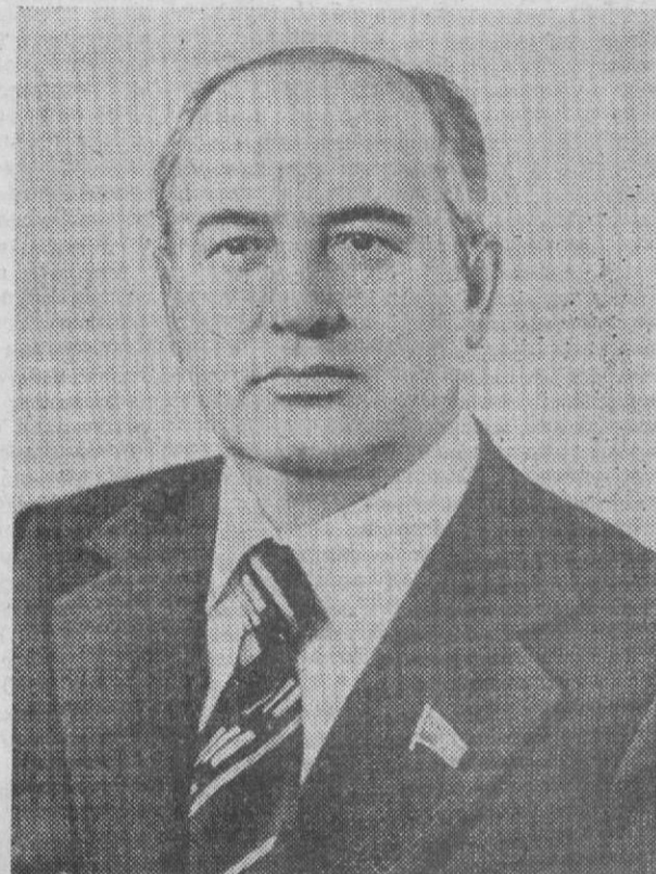
Михаил Сергеевич Горбачёв

Михаил Сергеевич Горбачев родился 2 марта 1931 года в селе Привольном Красногвардейского района Ставропольского края в семье крестьянина.