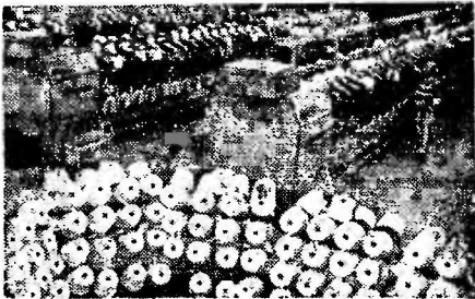
МОЛДАВСКАЯ ССР. Тираспольское хлопчатобумажное объединение считается флагманом текстильной индустрии республнции.

Дружный, работоспособный коллектив трудится в этом магазине. И думается, что он не раз еще будет выходить победителем в соревнованиях. Л. РАЗИНА.