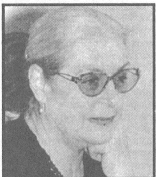
Машей складываются лучше, чем с Олей?

— Это правда, что ваши родительские отношения с