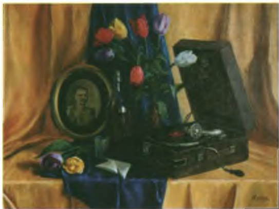
«Память». Холст, масло. 60х80.