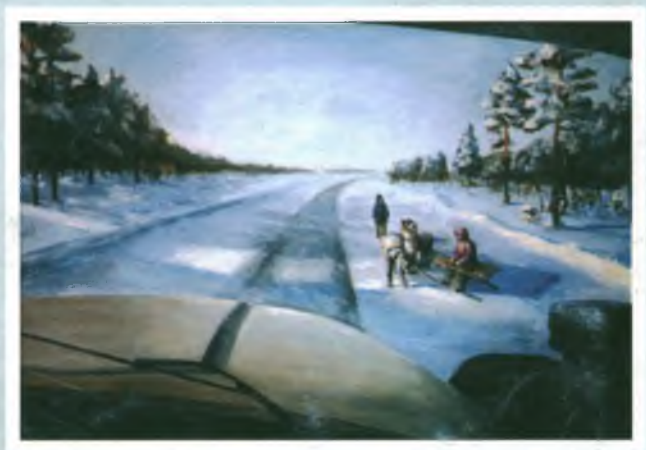
«Перекрёсток». Холст, масло.

Одно из предназначений каждого человека — быть творцом. Студия «Ракурс» является дверью и входом в удивительно прекрасный мир творчества. Студия — это соборность людей, объединенных и устремленных в мир высокого искусства, служения красоте и духу творчества.»