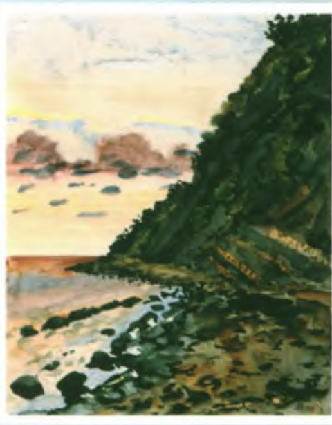
«Из морской серии». Бумага, акварель. 40х32.