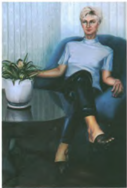
«Портрет жены». Холст, масло.