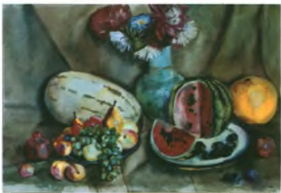
«Осенние дары». Холст, масло. 50х70.