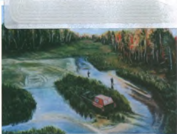
«Отдых геологов». Холст, масло.

«Специальность техника-строителя меня не устраивала. Желание рисовать, писать маслом присутствовало во мне с детских лет. В студию «Ракурс» поступила в 1997г. Обучение помогает приобрести богатейшие знания. Теперь я смотрю на окружающий мир, природу другими глазами. Занятия в студии для меня — бальзам для души!»