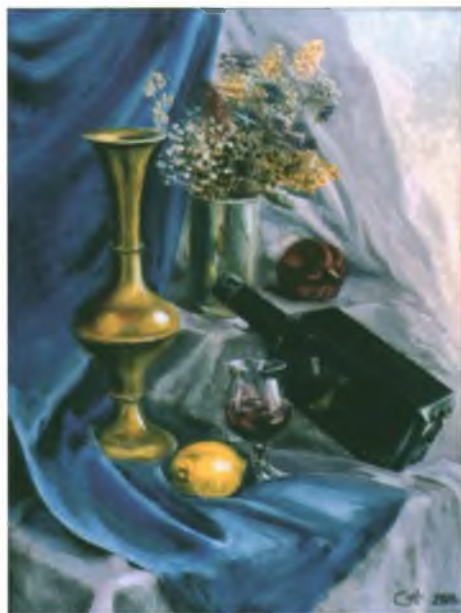
«Натюрморт с чёрной бутылкой». Холст, масло.

«Рисовать любила с детства. Часто посещала музеи и очень хотелось научиться самой изобразительной грамоте. В «Ракурсе» я с первых дней его существования. Первое время учеба давалась с большим трудом, хотелось даже бросить. Но, благодаря терпению преподавателей, учебу я завершила. Считаю, что нет ничего прекраснее, чем творить.»