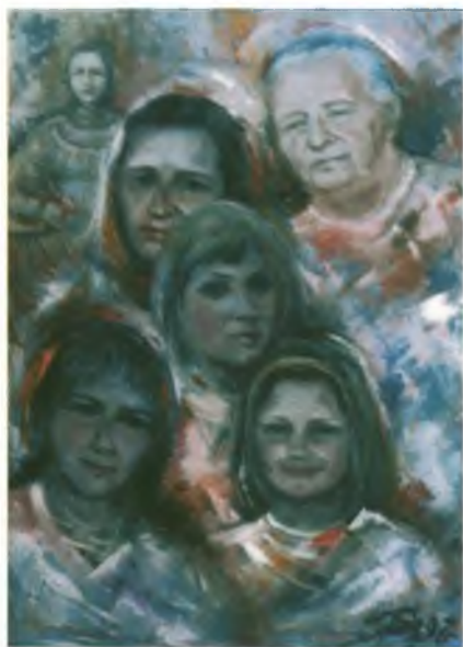
«Поколение». Холст, масло. 50х70.