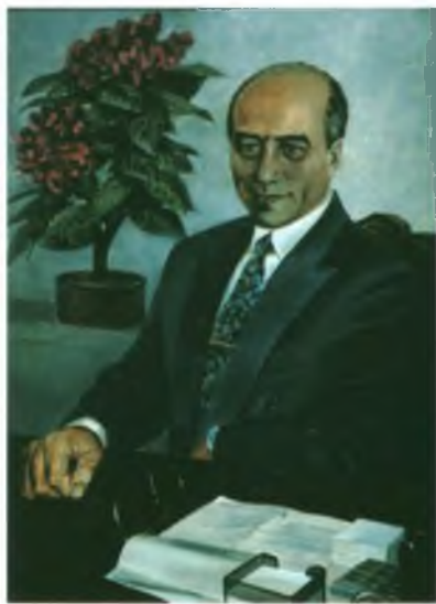
«Портрет В.М. Салахова».