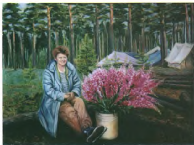
«Археолог Верочка». Холст, масло.