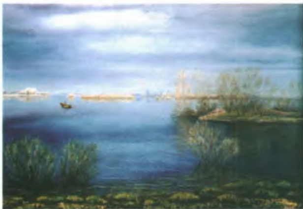
«Сайгатинский разлив». Холст, масло.

Здесь всегда открыты двери и рады людям творческим, увлеченным, т.к. наши педагоги сами являются таковыми. Заканчивая обучение в студии, я не говорю своим преподавателям «прощайте», я говорю им «до свидания».