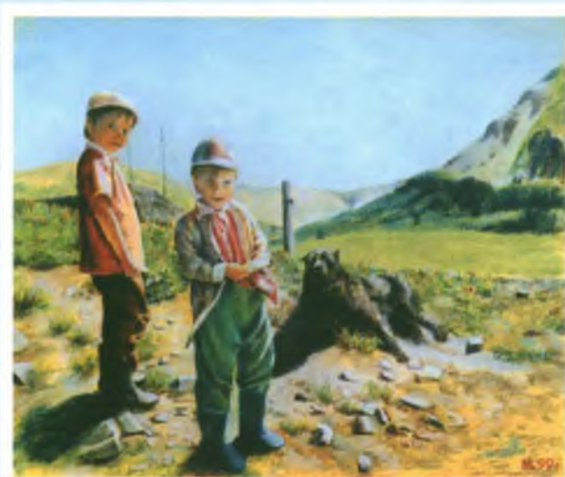
«Встреча в горах». Бумага, пастель.