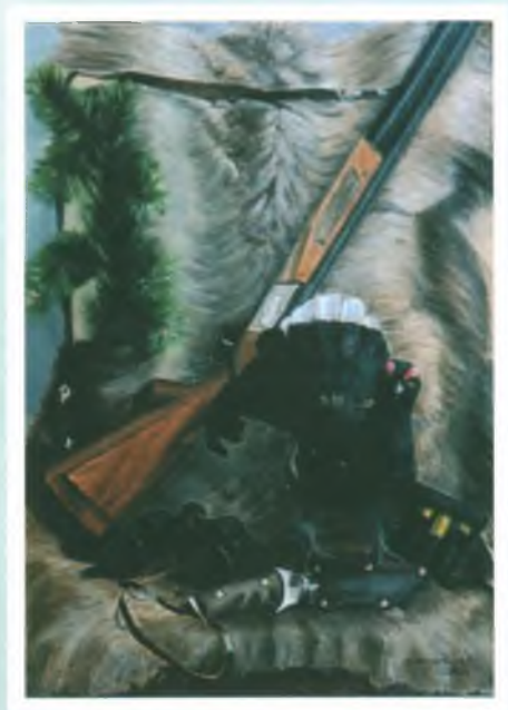
«Охотничий натюрморт». Холст, масло.

По прошествии лет моего обучения очень хочется сказать слова благодарности моим любимым преподавателям, которые научили, развили и показали как прекрасна наша жизнь с позиции художника, пробудили во мне чувства, эмоции, которые без художественного видения могли бы остаться незамеченными.»