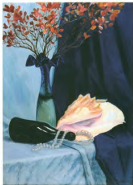
«Морской натюрморт». Оргалит, масло.