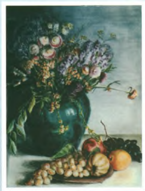
Из серии «Натюрморты». Бумага, темпера.