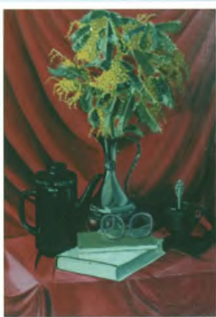
«Натюрморт с мимозой». Холст, масло.