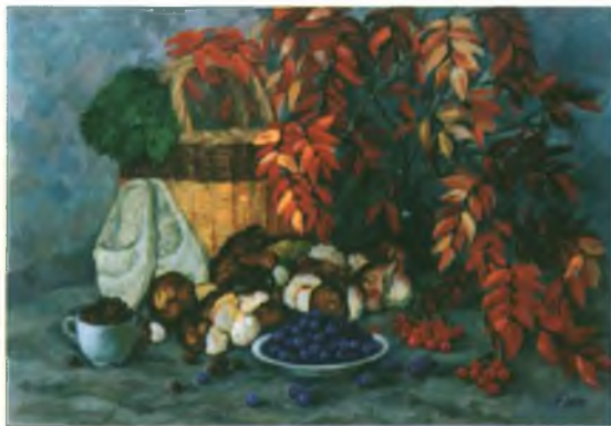
«Таёжные дары». Холст, масло. 50х70.