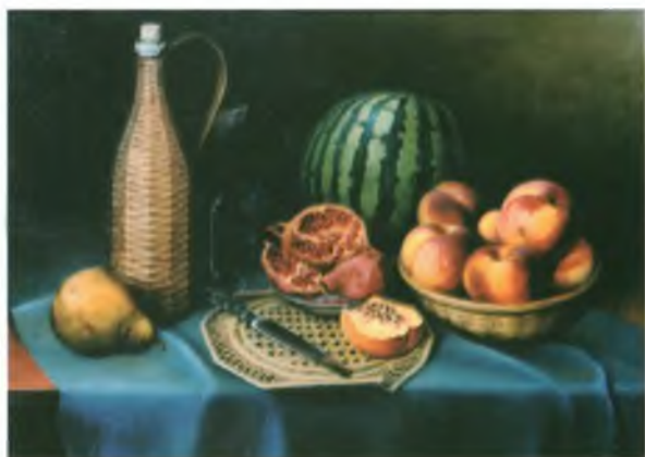
«Натюрморт с гранатом».

«В художественную студию «Ракурс» пришел, чтобы реализовать свой творческий потенциал, т.к. давно хотел заниматься живописью, но в ранние годы не использовал эту возможность. Имея семью и работу, наверное, не каждый человек сможет уехать в большой город, чтобы учиться в художественном заведении. Студия «Ракурс» — как раз то звено, которое помогает приобрести профессиональные навыки, учит академическим основам рисунка, живописи, графики, что в дальнейшем поможет состояться мне как художнику»