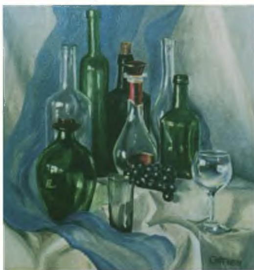
«После выставки». Оргалит, масло.