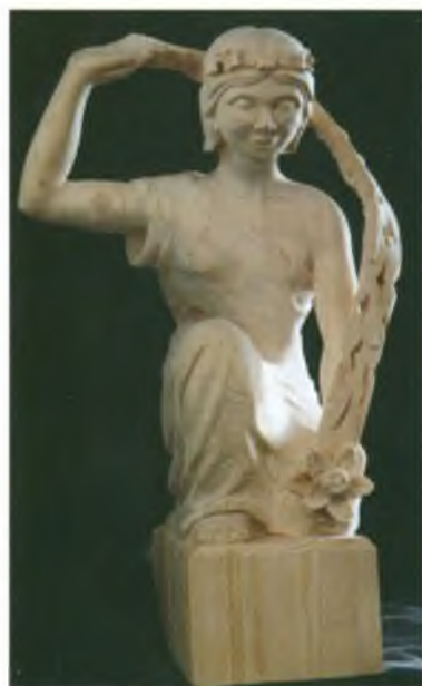
«Весна». Резьба по дереву, кедр.