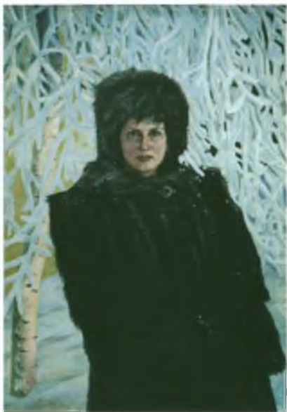
«Сибирская мадонна». Холст, масло. 100х70.